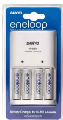
Akumulátor eneloop AA 1900 mA, blistr 4ks