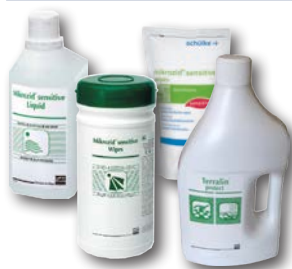
Dezinfekce na čištění manžet Mikrocid senzitive roztok, 1l