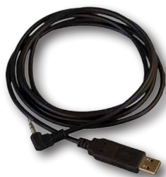
Kabel komunikační pro TM2430, BOSO