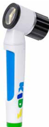
Dermatoskop LuxaScope LED KIDS