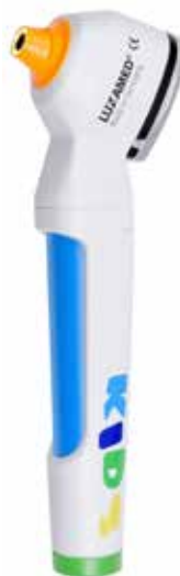
Otoskop LuxaScope Auris LED KIDS