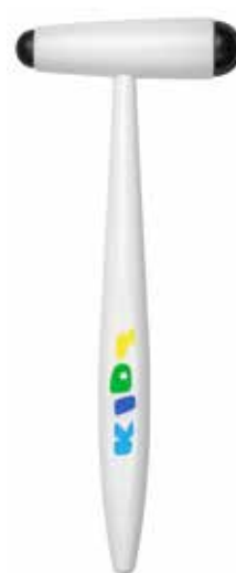
Reflexní kladívko Buck KIDS