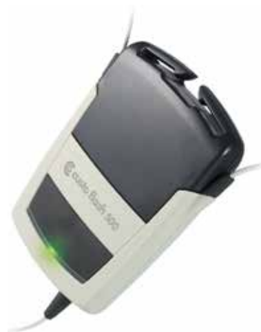
custo flash 510