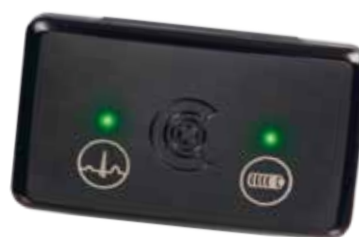
custo guard holter