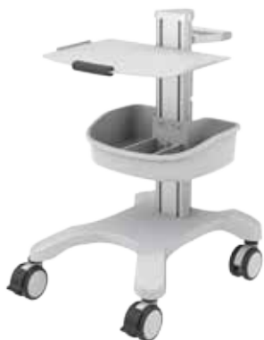
přístrojový vozík ECM