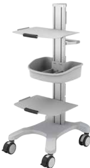
přístrojový vozík EC