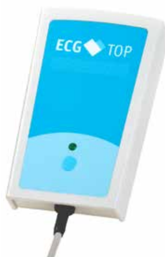
ECG-Top / ECG-Top BT