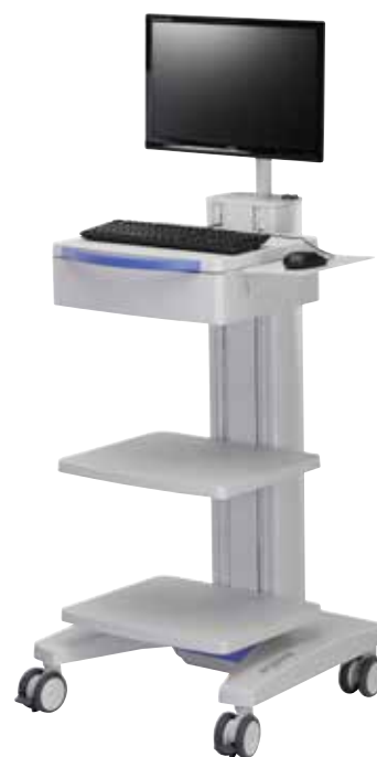
přístrojový vozík ergocar