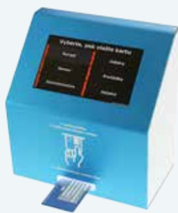
Elektronická fronta DISPLEJ

Místo rámusu a hádek, v čekárně pořádek? Dopřejte si klid spořádaných pacientů, které za Vás přijme elektronický systém NEKLEPAT CZ.