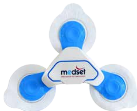
ECG Time S