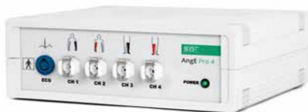
AngE Pro 4

4kanálová simultánní oscilografická pletysmografie