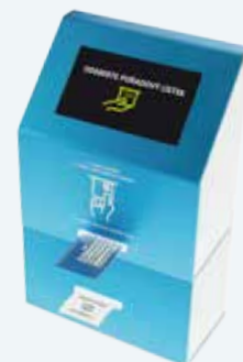
Vyvolávací systém PRINT

Propojeno s námi dodávanými ambulantními programy: