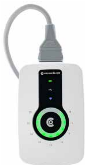
custo cardio 300 / 300 BT