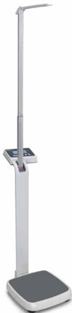
MPE 250K100HM s výškoměrem