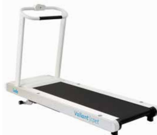
Valiant 2 CPET