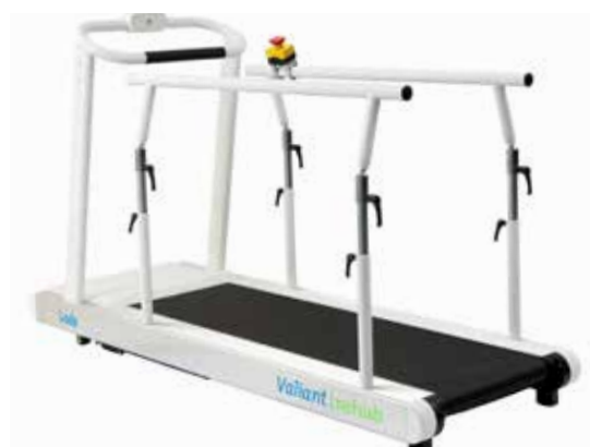
Valiant 2 Rehab vč. výškově nastavitelného zábradlí