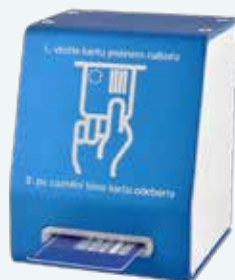
Elektronická fronta BASIC