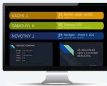
Vyvolávací systém LITE