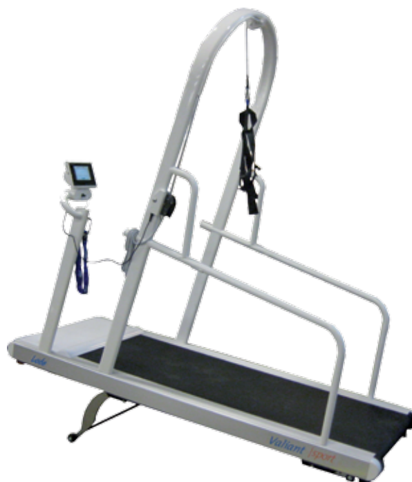
Valiant 2 Sport vč. zábradlí, zadržného systému, ...